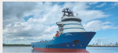
Delwedd ddangosol o long arolygu arferol. Mae'n bosibl mai nad dyma'r union long arolygu a ddefnyddir ar gyfer y Prosiect.

Mae manylion llawn unrhyw arolygon sy'n gysylltiedig â'n Prosiect ar gael yn yr Hysbysiad i Forwyr, a fydd yn cael ei gyhoeddi cyn i'r arolygon ddechrau. Bydd copïau o'r adroddiadau ar gael ar ein gwefan: www.morecambeandmorgan.com/morecambe