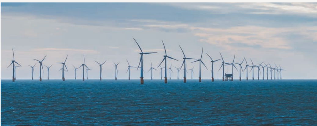
Delwedd ddangosol o fferm wynt ar y môr. Gall dyluniad gwirioneddol Asedau Cynhyrchu Fferm Wynt Alltraeth Morecambe ac Asedau Cynhyrchu Prosiect Gwynt Alltraeth Morgan fod yn wahanol.

Yn ystod yr ymgynghoriad, bydd cyfres o ddigwyddiadau yn cael eu cynnal wyneb yn wyneb ac ar-lein. Bydd hyn yn rhoi'r cyfle i bobl siarad ag aelodau o'r tîm, cael rhagor o wybodaeth am y cynigion, a gofyn unrhyw gwestiynau sydd ganddyn nhw. Ar ddechrau'r ymgynghoriad, bydd gwefan y Prosiect Asedau Trosglwyddo yn cael ei diweddaru ac yn cynnwys yr holl ddeunyddiau ymgynghori a gwybodaeth am sut gallwch chi gymryd rhan.